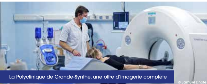
La Polyclinique de Grande-Synthe, une offre d'imagerie complète

Découvrez la vie médicale à Dunkerque. La Communauté urbaine de Dunkerque et les Villes de l'agglomération sont des partenaires facilitateurs pour toutes vos démarches d'installation.