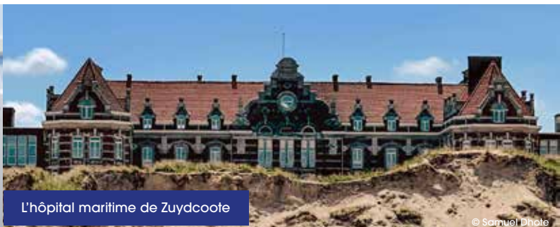
L'hôpital maritime de Zuydcoote